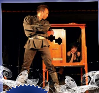
Mandrake de Cristal en 2012

Vivez des émotions étonnantes en découvrant ce nouveau spectacle «Le Troisième Acte». Grandes illusions et nombreux effets se mêlent pour créer une atmosphère très nouvelle, tout en finesse. Ce spectacle a été nommé par la Fédération Française des Artistes Prestidigitateurs «Spectacle de l'année 2013 / 2014» dans la catégorie «Grands Shows».