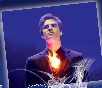
1 er prix au Congrès de magie de Bruxelles en 2009

Ces deux illusionnistes de talent nous offrent un spectacle unique qui allie le théâtre, la musique et l'humour. Le duo a remporté onze prix internationaux de prestidigitation, y compris un prix au Championnat du Monde de Magie FISM en Juillet 2012.